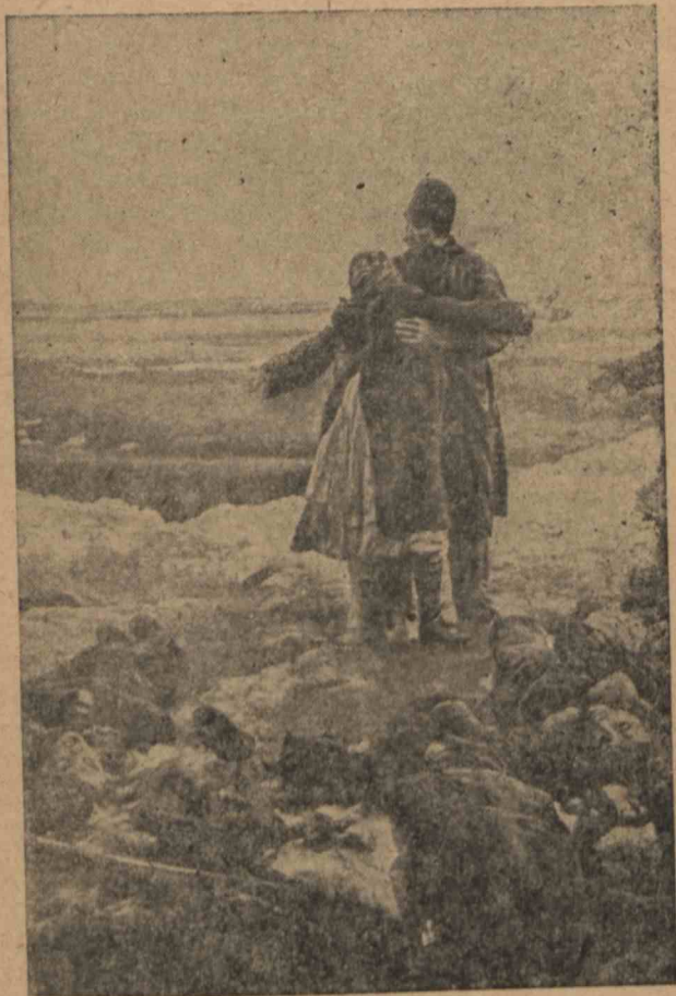
Отец и маъ нашли тело сына