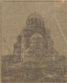
КАВЕДРАЛЬНЫЙ СОБОРЪ ГЪ Г. ОРЕНБУРГЪ.