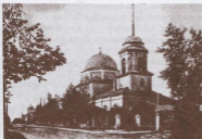
Петро-Павловская церковь (военная)

Таким образом, с архиерейского разрешения в 1755 году была заложена, а в 1758 году 12 июня освящена седьмая каменная церковь, Введенская, сделавшаяся зимнего соборною церковью взамен Успенской, упраздненной в том же 1758 году. По отношению к Преобра-