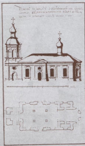
План и фасад Георгиевского собора в Фортштадте