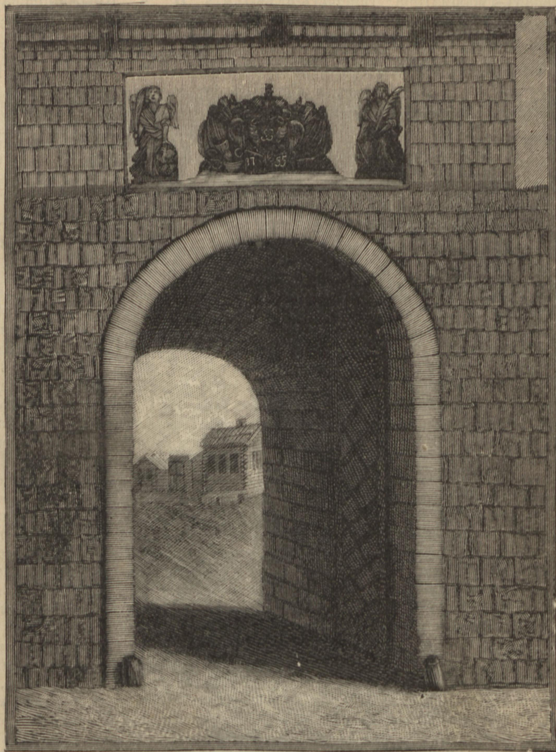
Памятникъ И. И. Неплюеву въ Оренбургѣ, въ прежнемъ видѣ.

были расположены на одной высотѣ: по срединѣ камни съ надписями, а по бокамъ ангелы (см. рис. № 2), что еще помнятъ многіе старожилы Оренбурга.