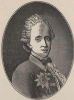
Николай Иванович Неплойевъ.