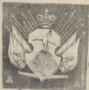
Грбъ Царства Грузискаго