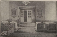
Надгробные памятники внутри храма.