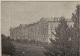
Мелниковскій Кадетскій корпусъ.