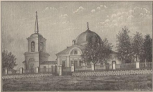
Наружный видъ Поддубскаго храма.