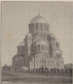
Новый Казанскій соборъ въ Оренбургѣ.