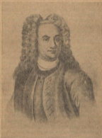
В. Н. Татищев

Родился он в 1686 году в Пскове (в том родовом поместье около Пскова) и происходил из знатного, но запущенного