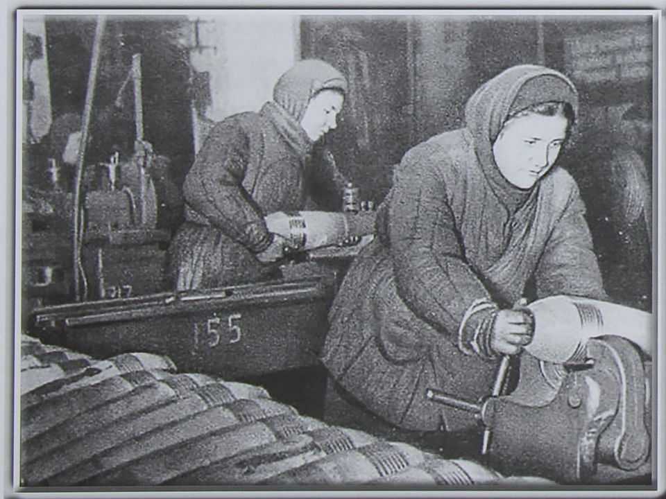
На фото: женщины за изготовлением авиационных снарядов

С первых дней войны была развернута серьезная работа и по вовлечению на производство женщин. Они заменяли уходящих на фронт мужчин. В информации Областного комитета КПСС от 8 августа 1941 года сообщалось: «На предприятиях города Чкалова с момента объявления войны стали работать 1 523 женщины. Создан резерв из женщин в количестве 1 922 человека на случай мобилизации мужчин».