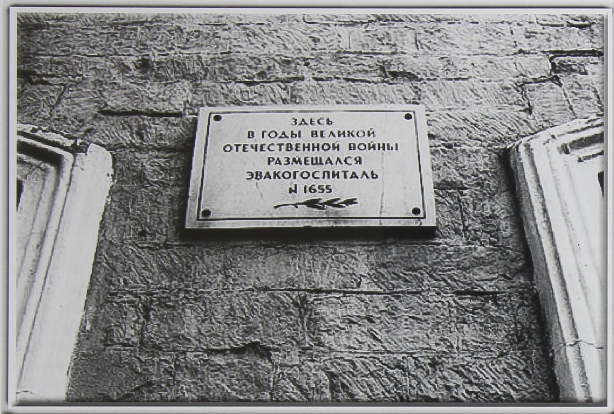
Эвакогоспиталь №1656, расположенный в здании педагогического института на ул. Советской, 21 (сейчас ул. Советская, 19)

За четыре года в госпитали Чкалова поступило 28 095 раненых и больных, из них только так называемых носилочных 17 тысяч. Оренбургский военный госпиталь с началом войны был доразвёрнут до 1 200 коек. В отдельные месяцы количество раненых и больных доходило до 1 400 человек. За четыре года войны через сортировочный блок госпиталя прошло более 26 тысяч раненых и больных, выписано из госпиталя 20 тысяч воинов, более 80% вернулись в строй. Медицинские работники Оренбургского госпиталя собрали и сдали в фонд обороны свыше 200 тысяч рублей. За это коллектив был удостоен благодарности Верховного Главнокомандующего И.В. Сталина.