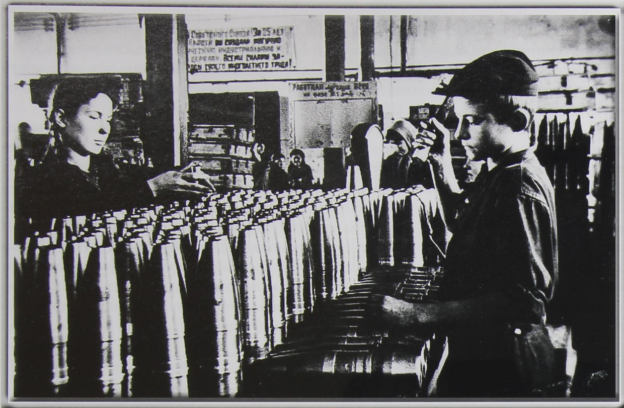
На фото: работа на заводах г. Орска в годы ВОВ

Орский мясокомбинат кроме мясной тушенки начал выпускать гранаты и 12 видов лекарств, среди которых – пенициллин. Во втором полугодии 1941 года он произвел продукции в 6,4 раза больше по сравнению с первым. В 1944 году коллектив мясокомбината был награжден орденом Трудового Красного Знамени. За высокие показатели и самоотверженность в труде в годы войны орденом Ленина был награжден Орский механический завод.