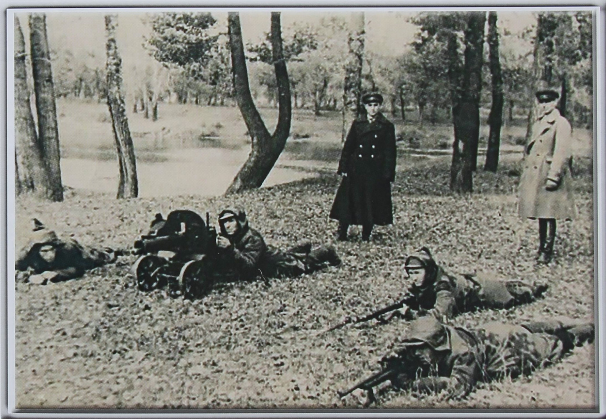
На фото: военные учения в Зауральной роще

Для работы в Чкаловскую область из разных уголков страны были эвакуированы 240 тысяч человек. Вместе с приезжими плечом к плечу днем и ночью трудились жители области. В кратчайшие сроки предприятия были переналажены на выпуск вооружения, боеприпасов и военного снаряжения. На всех заводах, особенно выпускающих оборонную продукцию, наращивались мощности и повышалась производительность труда. Подростки стояли у станков по 12–14 часов, а через несколько часов снова шли на завод, чтобы выпускать нужную для разгрома врага продукцию.