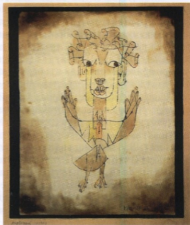
Пауль Клее. Ангелус Новус (Новый ангел). 1920. Акваель, тушь, цветные мелки, бумага

История... Неумолимое течение времени и... Кто из наблюдателей, современников происходящих