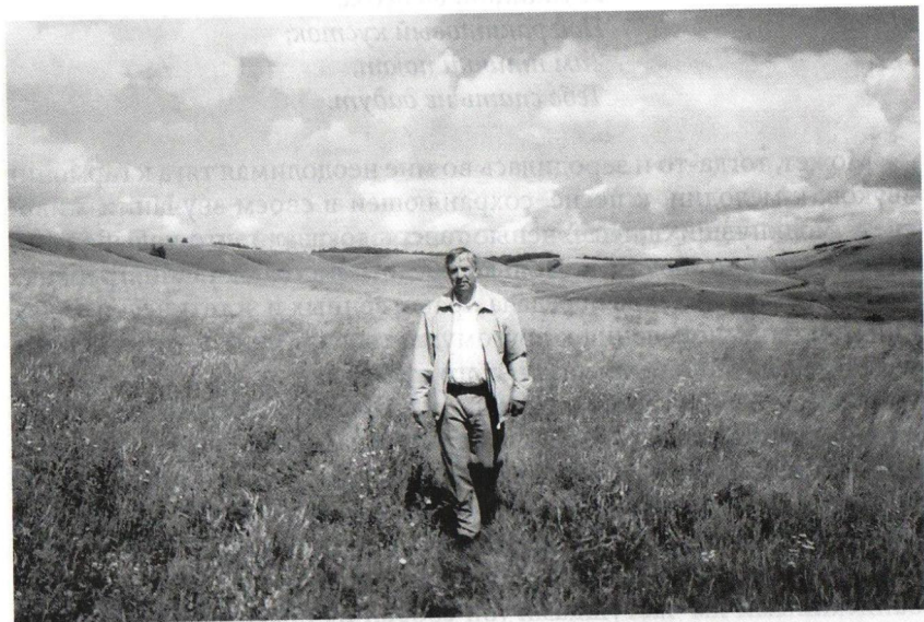
В родном краю

Мой отец, простой сельский механизатор, слыл первым на селе