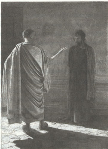
Н.Н. Ге. «Что есть истина?» Христос и Пилат.

Картина написана на известный евангельский сюжет.