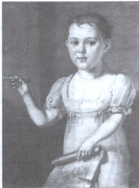
М.Ю. ЛЕРМОНТОВ В ДЕТСТВЕ. Портрет работы неизвестного художника. 1817—1818 гг.