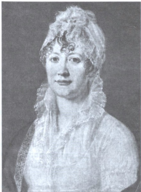
Е.А. АРСЕНЬЕВА — БАБУШКА ПОЭТА. Портрет работы неизвестного художника. Масло. Начало XIX в.