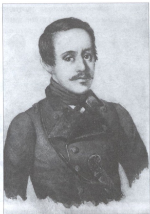
М.Ю. ЛЕРМОНТОВ В СЮРТУКЕ ОФИЦЕРА ТЕНГИНСКОГО ПЕХОТНОГО ПОЛКА.

Портрет работы художника К.А. Горбунова. Акварель. 1841 г.