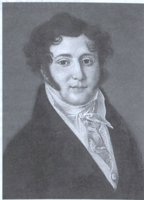
Ю.П. ЛЕРМОНТОВ – ОТЕЦ ПОЭТА. Портрет работы неизвестного художника. Масло. 1810-е гг.