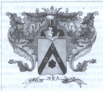
ГЕРБ РОДА ЛЕРМОНТОВЫХ