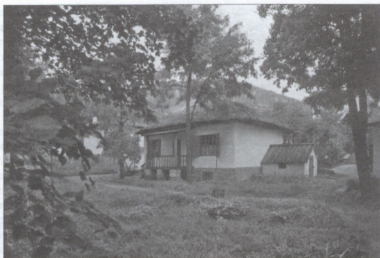
ГОСУДАРСТВЕННЫЙ МУЗЕЙ-ЗАПОВЕДНИК «ДОМИК ЛЕРМОНТОВА» (Пятигорск, ул. Лермонтова, д. 4). Современная фотография