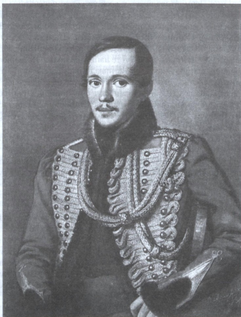
М.Ю. ЛЕРМОНТОВ В МЕНТИКЕ ЛЕЙБ-ГВАРДИИ ГУСАРСКОГО ПОЛКА. Портрет работы художника П.Е. Заболотского. 1837 г.