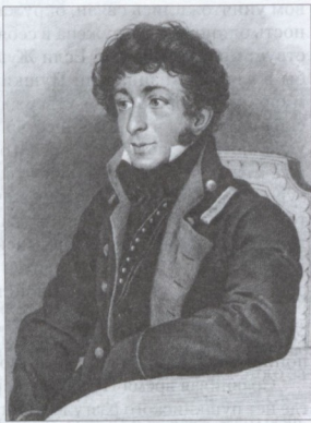
К.Н. БАТЮШКОВ. Гравюра И.П. Пожалостина (1883) по оригиналу О.А. Кипренского (1815)