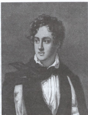
ДЖ. Г. БАЙРОН. Литография. 1830-е гг.