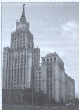
ВЫСОТНОЕ ЗДАНИЕ НА ПЛОЩАДИ КРАСНЫХ ВОРОТ (на месте дома, в котором родился М.Ю. Лермонтов; вид со стороны Красных ворот, разобранных в 1928 г.)