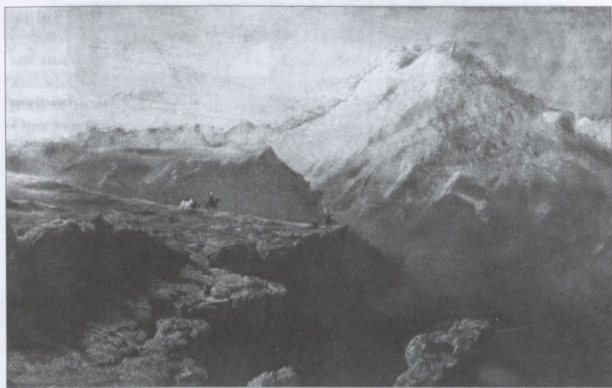
М.Ю. Лермонтов. ЭЛЬБРУС НА ВОСХОДЕ СОЛНЦА.