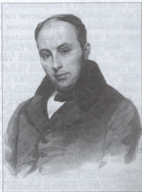
В.А. ЖУКОВСКИЙ. Портрет работы художника П.Ф. Соколова, 1836 г.