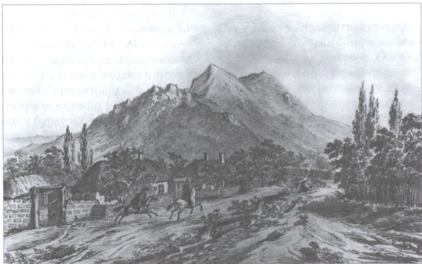
ГОРА БЕШТАУ БЛИЗ ПЯТИГОРСКА.

Портрет работы художника К.А. Горбунова. Акварель. 1841 г.