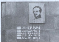
МЕМОРИАЛЬНАЯ ДОСКА НА ВЫСОТНОМ ЗДАНИИ.