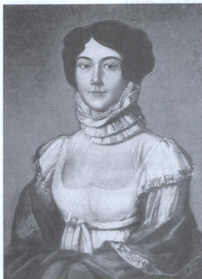
М.М. ЛЕРМОНТОВА (УРОЖД. АРСЕНЬЕВА) – МАТЬ ПОЭТА. Портрет работы неизвестного художника. Масло. 1810-е гг.