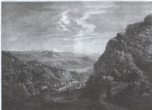
М.Ю. Лермонтов. ВИД ПЯТИГОРСКА. 1837–1838 гг.