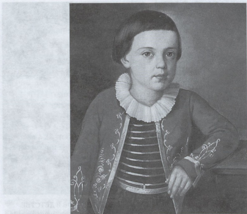
М.Ю. ЛЕРМОНТОВ В ДЕТСТВЕ.

Портрет работы неизвестного художника. Масло. 1820—1822 гг.