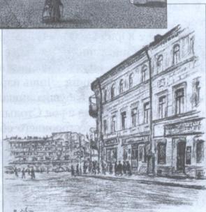
ДОМ НА УГЛУ КАЛАНЧЕВСКОЙ УЛИЦЫ И ПЛОЩАДИ КРАСНЫХ ВОРОТ, В КОТОРОМ РОДИЛСЯ М.Ю. ЛЕРМОНТОВ.

Гравюра Ф. Дюрфельда (начало 1790-х гг.) по рисунку М.И. Махаева (1763)