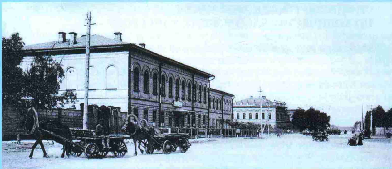
Александровская (Мещанская) больница в Оренбурге