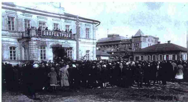
Оренбург – столица КССР

Необходимость скорейшего перехода к практической работе диктоваласькратно увеличившимся количеством венерических больных. Так, например, в 1923 году только в Оренбурге было выявлено 774 заболевших сифилисом (6,5 на 1000 человек населения). Всего же по губернии этот показатель составил 3,4 на 1000 человек населения, что превышало дореволюционные значения. В губернском центре началась последовательная работа по противодействию ИППП.