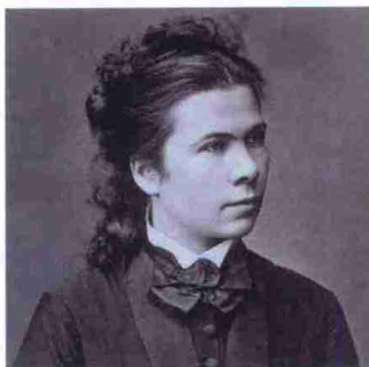
Варвара Руднева-Кашеварова: первая в России дипломированная женщина-врач

Увы, но Оренбургскому краю, оплатившему ее учебу, Варвара Александровна никогда не служила. Причина крылась в том, что зачисление талантливого венеролога в штат местного военного госпиталя значило бы предоставление ей права государственной службы, а такого прецедента не хотели допускать. Тем не менее именно Оренбург помог Кашеваровой стать первой женщиной, получившей диплом врача и защитившей диссертацию в России.