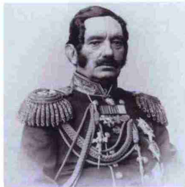
Александр Павлович Безак (1800–1869), оренбургский и самарский генерал-губернатор