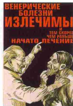
Советские плакаты, 1920-е годы