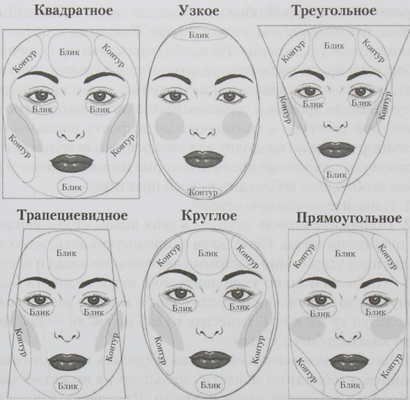
Рис 8.3. Техника нанесения румян в зависимости от формы лица

добыться инструменты для макияжа. Для кремовых текстур — идеальна плоская скошенная кисть: она удерживает больше продукта благодаря плотно прилегающим друг к другу щетинкам. Еще можно просто воспользоваться пальцами, но для растушевки лучше использовать спонж или специальную щеточку. Более пушистая угловая кисть подойдет для нанесения пудры.